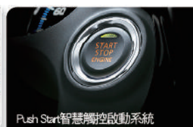
Push Start 智慧觸控啟動系統