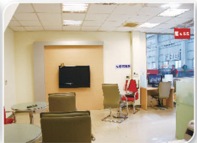
簡約的客戶休息室