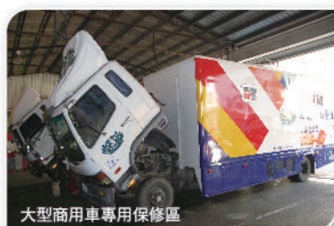
大型商用車專用保修區