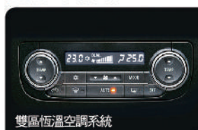
雙區恆溫空調系統