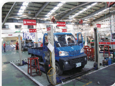
小型商用車保養維修區