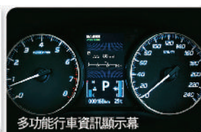
多功能行車資訊顯示幕