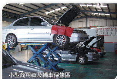
小型商用車及轎車保修區