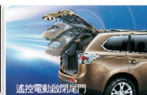
遙控電動啟閉尾門