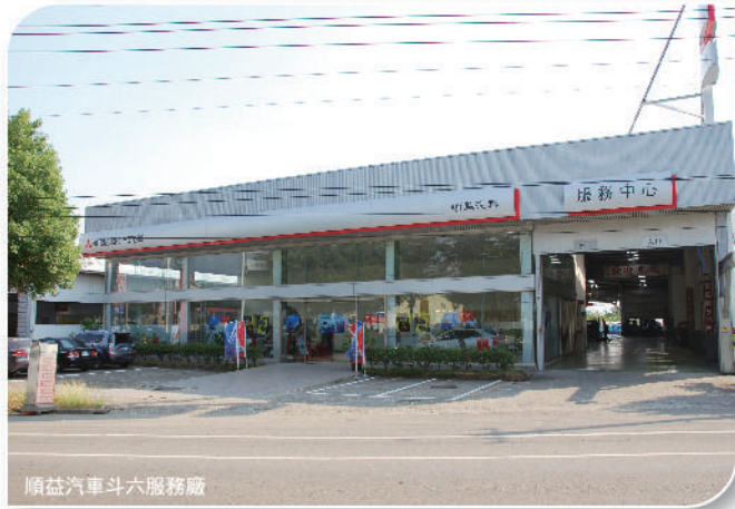
順益汽車斗六服務廠