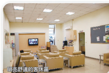
明亮舒適的客休區