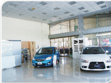
明亮清新的展示中心

六十多公里，且人口大多集中在斗六及虎尾，其餘鄉鎮地廣人稀，需要提供客戶到府取車及24小時不間斷的服務，讓客戶感受順益汽車體貼便民的用心，在車子需要幫忙時都能找到專人服務。另外，廠內每位技師的服務不僅局限於車輛維修及保養，在斗六服務廠的服務團隊只要是關於車輛的問題都能為您服務，無論是車子保險、美容、定檢或是小商車專用車斗，都能幫你處理接洽，就連罰單都能幫你代繳，這就是順益汽車斗六服務廠建立的全方位汽車服務網，只要是車子的大小事，來順益汽車斗六服務廠就對了。