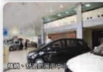
精緻、舒適的展示中心