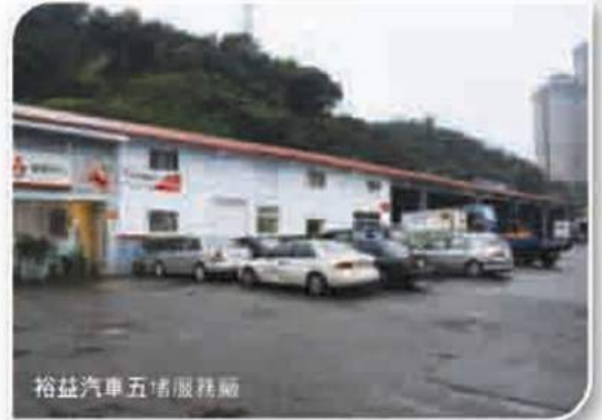
裕益汽車五堵服務廠

裕益汽車五堵廠位於國道一號高速公路旁，下五堵交流道後十分鐘的路程，北臨六堵工業區，西接62號東西向快速公路連接國道三號高速公路，是基隆港貨櫃進出必經之處，交通都非常便捷，對於客戶來廠維修和保養都很方便，面對急需道路及夜間救援的客戶可大大提升到現場支援之效率。