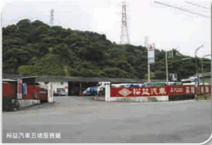
裕益汽車五堵服務廠