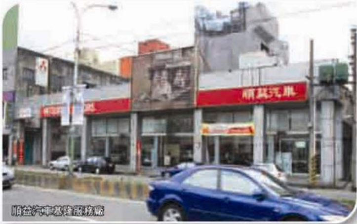
順益汽車基隆服務廠